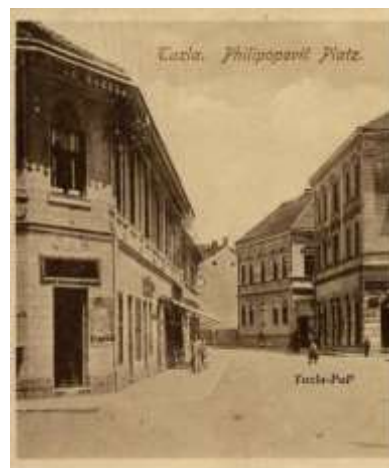
Slika 14. Zgrada Pere Stokanovića iza zgrade Srpskog fonda oko 1904. i isti objekat 2014.