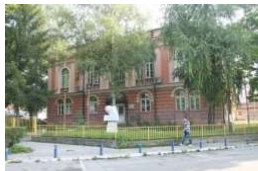
Slika 6. Trgovačka akademija 1912. i Elektrotehnički fakultet Tuzla 2014