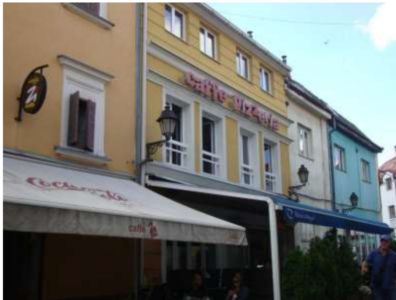
Slika 10. Nekadašnja trgovine obućom ČIK, danas caffe pizzeria

Cordignano i Candotti su projektovali i gradili veći broj privatnih objekata u Tuzli. Projektovali su i gradili stambene objekte u kojima su živjele njihove obitelji. Slika 11 ilustruje izgled objekta koji je bio u vlasništvu Cordignano kad je napravljen i izgled 2014. godine. Objekat se nalazi u neposrednoj blizini NLB banke na putu prema gradskom zatvoru. U prizemlju objekta smještene su advokatske kancelarije, a na spratu su stambeni prostori u kojima žive vlasnici objekta.