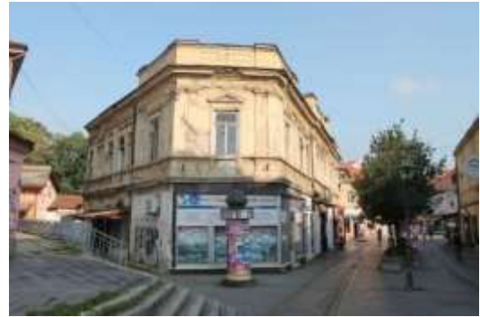
Slika 8. Trgovinski objekti na Kapiji Goldstein i sin i Trans Turist Tuzla 2014.