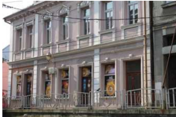
Slika 9. Gambergerova kuća – nekad kafana "Balkan" danas casino klub