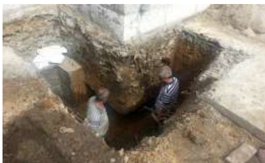
Slika 21. Crkva u Sivši 1988. godine i rekonstrukcija temelja crkve 2014. godine