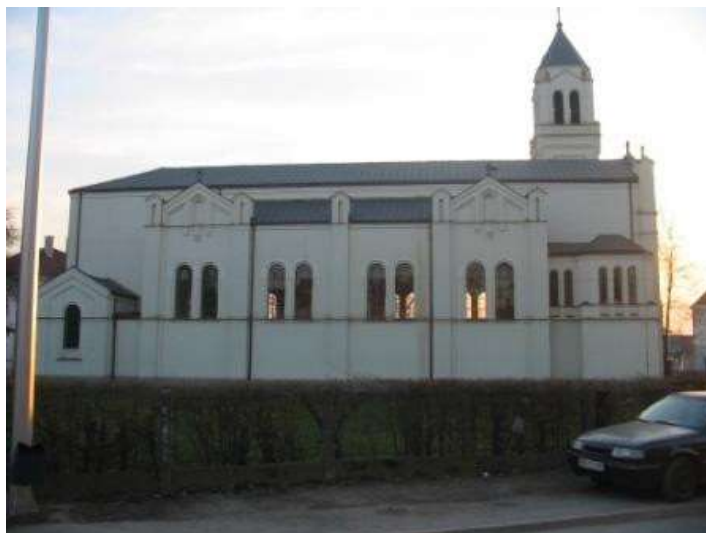
Slika 20. Crkve Presvjetlog Srca Isusova u Brčkom