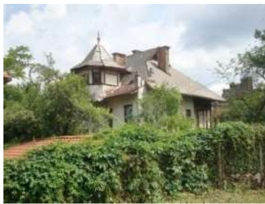
Slika 22. Identični stambeni objekti na Golom brijegu