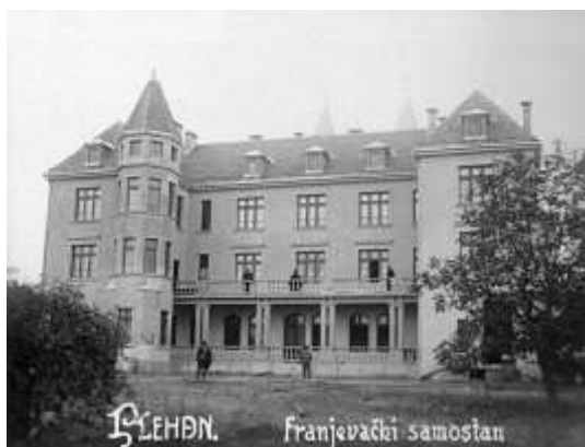
Slika 19. Graditelji samostana u Plehanu i izgled samostana