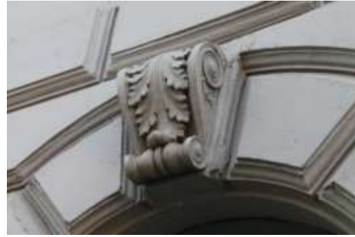
Slika 3. Detalji fasada na zgradama u centru grada Tuzle