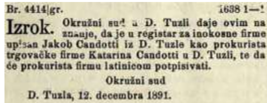
Slika 4. Sudska registracija firme Candotti Donja Tuzla

očigledno da se radilo o partnerstvu Italijana koje je bilo zvanično potvrđeno registracijom građevinske firme Cordignano i Candotti. Projekti su se odnosili na javne institucije, a izgradnja objekata se odnosila na javne, vjerske i privatne objekte. Nije evidentirano da su radili na industrijskoj infrastrukturi, iako je Tuzla doživljavala ekspanziju poduzetništva otvaranjem rudnika uglja, slanih bunara i solana, električne centrale, pivnice, tvornice špirita, itd.