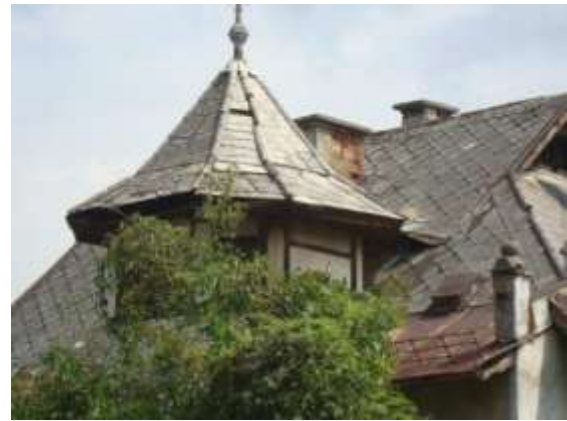
Slika 2. Detalj krova na jednoj od dvije kuće blizanke na Golom brijegu