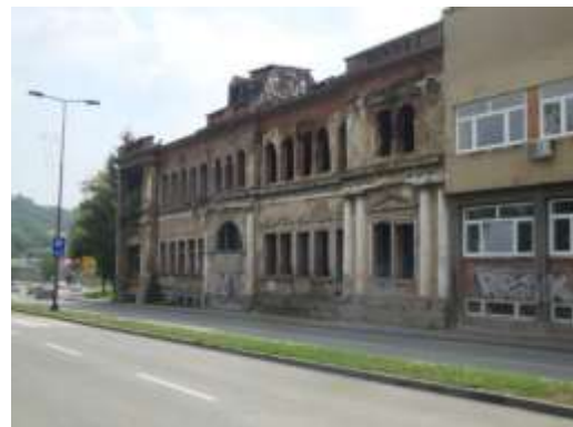
Slika 16. Okružna pošta u Tuzli izgrađena 1901 (a), stanje 2014 (b)