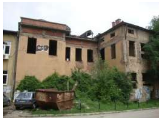
Slika 17. Okružna pošta u Tuzli detalj fasade sa stubovima na ulazu (a), stražnja strana objekta (b)