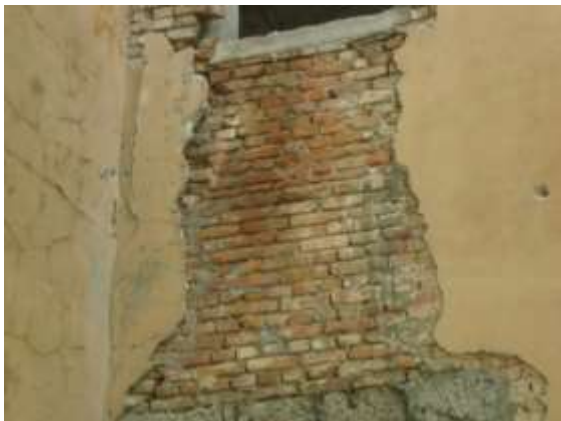
Slika 1. Detalj zidova građenih punom opekom (objekat Stare pošte)

U cilju efikasne urbanizacije gradova u kojima je Austro-Ugarska imala politički, privredni, vojni ili kulturni interes, austrijski Car je 1880. godine potvrdio Zakon o gradnji, kojim su svi građani koji su željeli graditi novi objekat bili oslobođeni poreza na kuću od 20 do 30 godina, a za adaptaciju postojećih objekata vlasnici su bili oslobođeni poreza od pet do 15 godina (u zavisnosti od veličine adaptacije). Zakonom je bilo definisano da su lokalne vlasti bile ovlaštene da izdaju dozvole, a graditelji su morali imati precizne arhitektonske planove. Građevine se nisu mogle graditi direktno na ulicama, a zakonom je bila propisana visina stropova, debljina zidova, kao i materijali od kojih će zgrade biti pravljene. Umjesto ćerpiča i ceremide, nova vlast nametnula je korištenje novih materijala za građenje, pa su prvi put u upotrebi materijali opeka, crijep i beton. Tako su i građevinski poduzetnici Cordignano i Candotti koristili opeku (slika 1.) i eternit (kvadratne azbestcementne ploče - slika 2.) ili falcovani crijep u gradnji objekata, a fasade se bile dekorisane potkovičastim lukovima, horizontalnim linijama eksterijera, a često i lukovičastim kupolama, prikazano na slici 3.