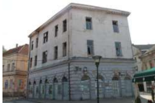
Slika 7. Zgrada Srpskog fonda i isti objekat 2014.