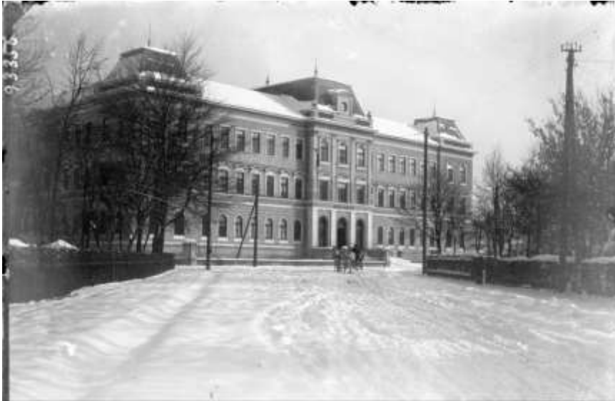
Slika 5. Velika Gimnazija u Tuzli 1899-1966