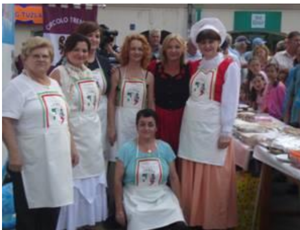
Treći put 2012. godine ||| Četvrti put 2013. godine