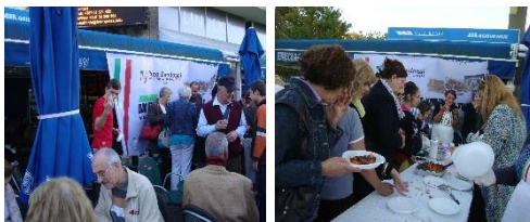
Prvi put 2010. godine ||| Drugi put 2011. godine